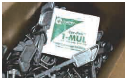
NSN#6850-01-470-2737、GSA#8030012081769 認証 内包する防錆剤は、MIL-I-22110C。取得