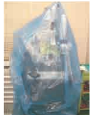
「超微細化加工用切削刃物製造装置」のカバーに使用されたVpCI-126ガゼット袋

現在では、微小な部品に限らず、写真のような超微細化加工用切削刃物製造装置の防錆保護にもVpCI-126ブルー防錆フィルム製のガゼット袋が使われている。