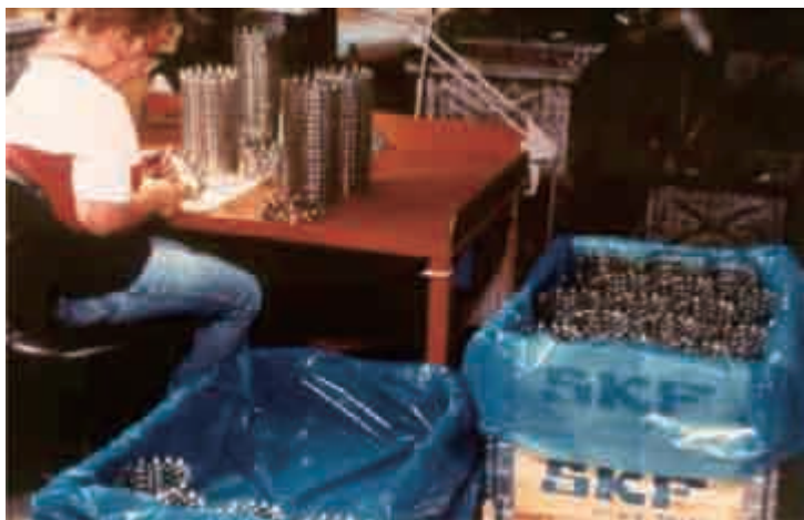
SKF ベアリング工場で VpCI-126 ブルー防錆フィルムを使用

長期間にわたる試験を経て、最終的に採用されたのがコーパック 1-MULである。コーパック 1-MULは、通気性のある紙製ポーチ入りVpCI防錆パウダーで、様々な金属の防錆に使うことができ、1つで28ℓの容積の空間にある金属を2年間保護防錆する。粉状気化性防錆剤が使用できない場所でも、使用できる環境にやさしい製品でもある。