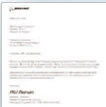
ボーイング社からの手紙

ボーイング社には、以前から航空機の保守にVpCI-126 ブルー防錆フィルムをはじめとするコーテック製品をご利用いただいている。これはボーイング社からコーテック宛てに届いたメッセージである。