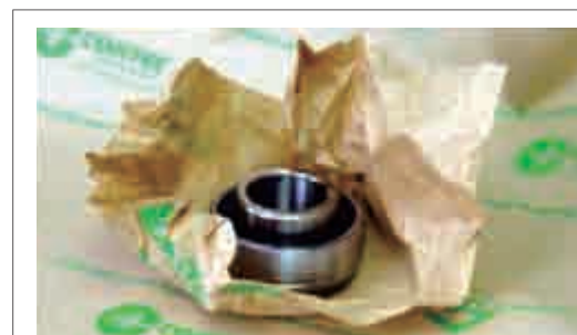
VpCI-146 マルチメタル防錆紙

植物を原料としたVpCI-325は、環境にやさしい生分解性の油性防錆剤で、鉄や亜鉛、アルミ、銅など幅広い金属に使用できる(MIL-C-81309E)。また、VpCI-146 マルチメタル防錆紙は、鉄や非金属の防錆に使われるクラフト紙製品で、リサイクルが可能である。